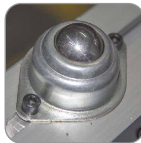
Deslizador de plancha