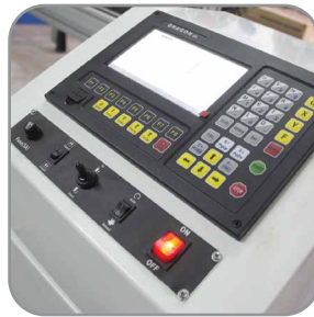
Panel de control Pantalla 7"

Tan precisa y estable como un portico tradicional, fácil instalación y ajuste por el usuario.