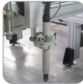
Antorcha Plasma Con control de altura