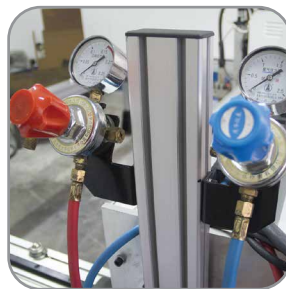
Entrada de gases Oxígeno/Acetileno.